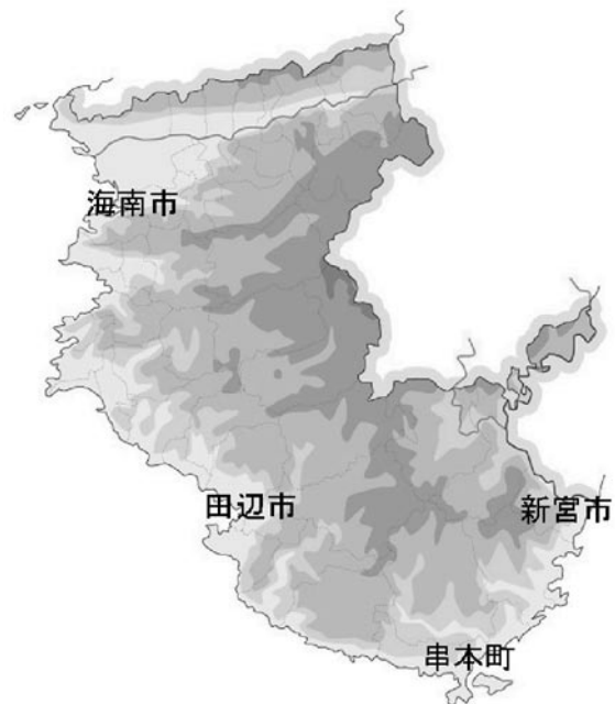
図 1 昭和南海地震の調査地域

ここでは現地調査も交えて、より完成度の高い津波分布を作成し、具体的に個人がどのようなルートで避難したのかをデータとして収集することにした。また従来の体験談は感情的な面が大きく、科学的な事実が