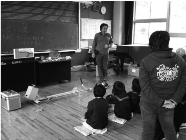
写真3 小型地震計を利用した出前授業

小学生の皆さんに地震の授業ということで、ふだんは見ることのできない地震計を見せることで、関心と呼ぶことができた。授業では机を揺らすことによりガルという加速度の単位が表示されて、震度〇という表示がでるということ、現在の震度は全て計測震度型によって求めた値であることを知ってもらった。また地震というのは地震波という波から作られており、写真2のような波形を見せると理解しているようだった。