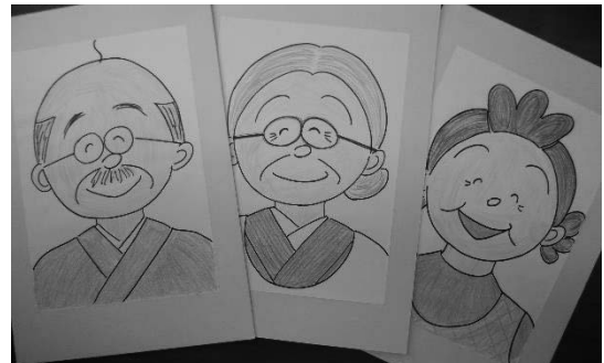
図4 ロールプレイングに用いたフェイスボード