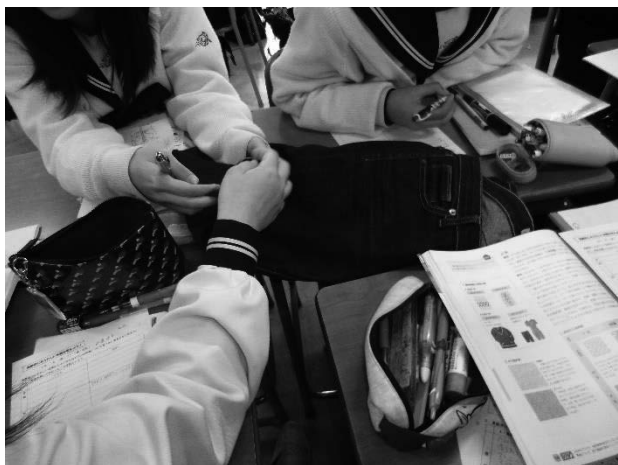
図1 サンプルを見ながら話し合う様子

小題材3「高齢者の衣生活を知らう」の授業は、グループで考えた衣生活での問題点を改善し、高齢者にとって快適・安全な衣服を考える授業である。昨年度は、高齢者にふさわしい冬用のシャツを題材として取り上げ、全グループにそのシャツについて考えさせるものであった。今年度は、上衣だけではなく、学級のグループのうち半数は下衣について、高齢者にどのような「形・素材・色柄」のズボンがふさわしいかを考えさせる内容に改善した。そのようにすることで、シャツだけの場合には、腕や指先の動きなど上半身の身体的特徴を考えることが中心になってしまったが、ズボンを加えることで下肢の運動機能や平衡性についても具体性を持って理解を深めさせることができた。さらにここで理解した下肢の運動機能や平衡性の低下は、後で学習させる住生活での不自由さや家庭内事故とも大きく関わることであり、衣と住の両分野を関連させて高齢者の生活を学ばせることにつながった。