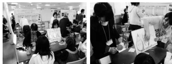
図3 おもしろ科学まつり実験風景

実際に指導した大学生の感想としては、「直接子どもたちに接することができ、大変有意義であった。」との意見が大多数を占めた。また、「子どもたちを指導する大変さを痛感した。」や「グループで意見を出しあうことで、より良い出展内容になった。」などの意見も見受けられ、今回の科学まつりに参加したことが今後の教師生活に大いに役立つものと思われる。