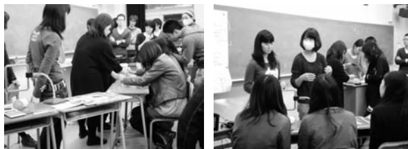
図2 出展発表の練習風景

11月4日に、おもしろ科学まつり和歌山大会の出展内容を授業の中で発表した。この段階で、実験工作の予備実験はほぼ終了し、残り1か月で当日の準備物や工作時間の最終確認を行った。