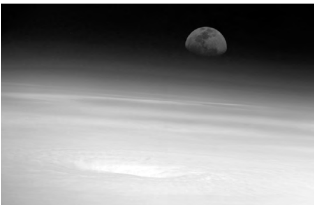
図1 2005/7/16にメキシコ湾上空ISSから撮影された月

「 ハッブル宇宙望遠鏡が撮影した惑星や系内/系外の星雲星団の写真 」：宇宙探査は、先ず無人探査機が行って写真や観測データを送り、次に無人探査機がサンプルを持ち帰り、その後人が行って五感で感じ探査するというように惑星探査と有人宇宙開発は繋がっていく