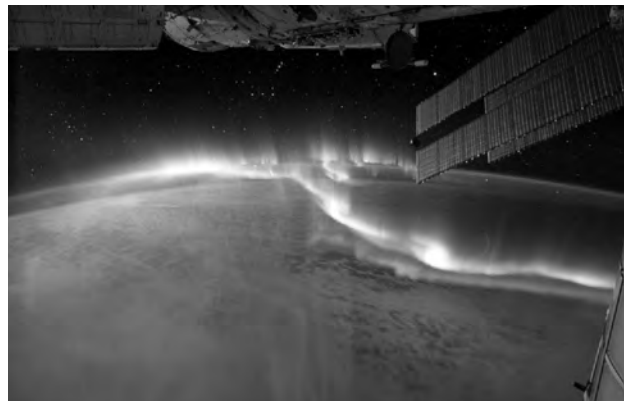
図2 2011/9/17にISSから撮影されたオーロラ

「 流れ星が大気を横切って燃え尽きる様子 」：ISSより大気圏の方が低いので、「見下ろす」という点で、地上とは全く違う(※)。