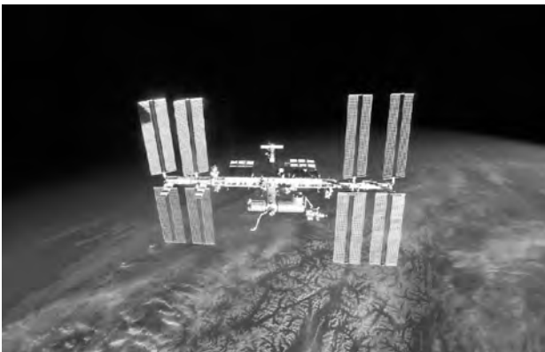
図5 2010/4/17にスペースシャトル・ディスカバリーから撮影したISS

「人工衛星」：数回見ることができた(視野の範囲を横切るとき(※))。地上で見えるのと同じように見える(※)。白い星のような光が夜空を横切るように小さな点で見える(※)。