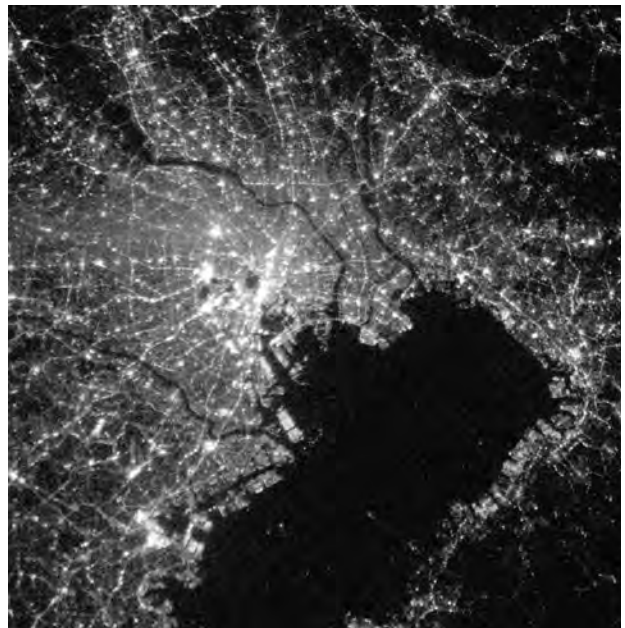
図4 2008/2/5にISSから撮影された東京の夜景