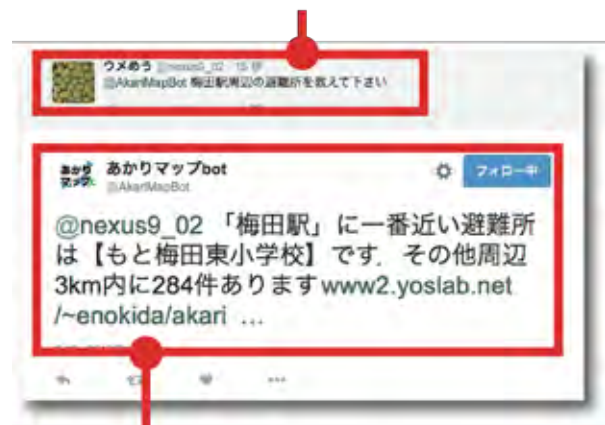
(b) あかりマップ bot からの周辺の防災情報の提供