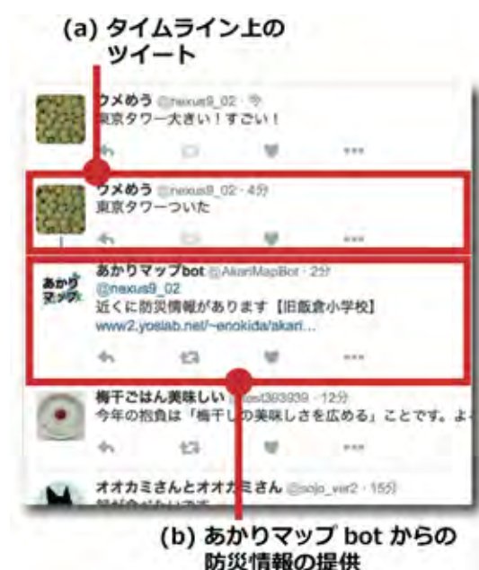
図-2 タイムライン上のツイートへの応答例