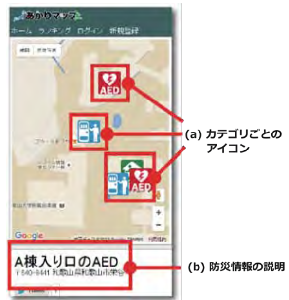
図-4 提供される詳細な防災情報の画面例