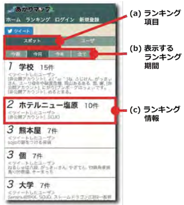
図-6 スポットランキングの画面例

画面内の「スポット」(図-6(a))を選択することで表示される。「スポット」は、ツイートに含まれていた位置表現のことを指す。スポットランキングは、期間中あたりマップbotの全フォロワーが訪れたとして推測されるスポットの件数で順位付けを行っている。ランキング情報(図-6(c))には、スポット名、スポットが含まれるツイートの件数、スポットを含むツイートを発信したユーザ名を表示している。なお、Twitterのアカウント設定を非公開にしている場合、ユーザ名は表示してい