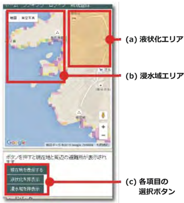
図-5 浸水域エリアと液状化エリアの表示例

エリアの情報を閲覧可能である。画面内のマップ上に表示されている図-5(a)が液状化エリアを示し、図-5(b)が浸水域エリアを示している。画面上の「液状化」および「浸水域」の表示・非表示ボタン(図-5(c))を選択することで、各情報の表示と非表示を切り替えることができる。