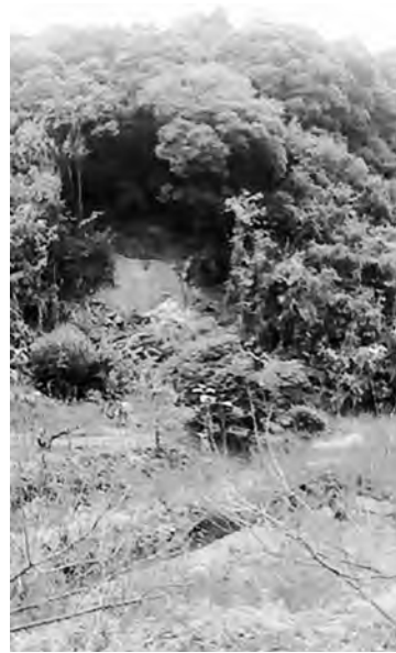
写真1 2011年9月豪雨災害で崩落した文覚井一井の萩原線

(補注2) 杵田荘保存運動史の意味合いをもって執筆した、註2の海津『『紀伊国杵田荘』始末記-かつらぎ町史編集委員会との一五年論争を中心に-』を掲載した『和歌山大学紀州経済史文化史研究所紀要』32号(2011年12月号)の入手希望者は、送料負担のみで頒布している。和歌山大学紀州経済史文化史研究所(電話073-457-7891)に連絡していただきたい。