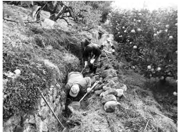
写真2 崩れた文覚井一井を現状復元する萩原・窪の住民(2011年11月27日)