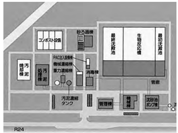
図2 伊都浄化センター 現況

堤防遺跡が沈殿タンクで破壊される計画になっていたが、北側に移動して空地(道路)をつくることで現状保存した。