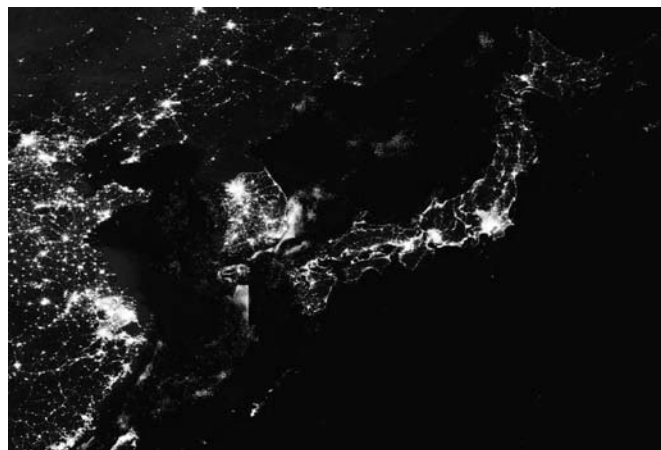
写真1. Suomi NPP 衛星が2012年に撮影した夜の地球から日本付近を切り出したもの

(翌年から全国星空継続観察として2012年まで開催されている)が実施され、星空の美しい108の市町村が「星空の街」に選定され、和歌山県下では美里町が選ばれている。星空の街はその後も増え、かわべ天文台公園のある日高川町も加わり、2012年に第24回「星空の街・あおぞらの街」全国大会を日高川町に誘致している。天文台建設には多額の予算が必要であるが、同じ時期に望遠鏡を購入できる資金が国から降ってきている。1988年に竹下内閣が「自ら考え自ら行う地域づくり事業」(通称「ふるさと創生事業」)で交付した1億円である。この事業では、自治体が自由に使い道を考えることができたため、この時期に「星空の街」に選定された多くの自治体が天文台建設にその予算を投じている。なお、星空の美しさは地上からの観察をしなくても、人工衛星からの夜景の映像を見れば一目瞭然である(写真1)。和歌山が位置する紀伊半島がいかに暗いか、つまり美しい星空が残されているかを宇宙から確認することができる。半島であるために、現代の日本の経済活動の中心軸である東海道～山陽道の東西軸から外れ、その上に大きな半島であるために広いエリアで美しい星空が残されている。